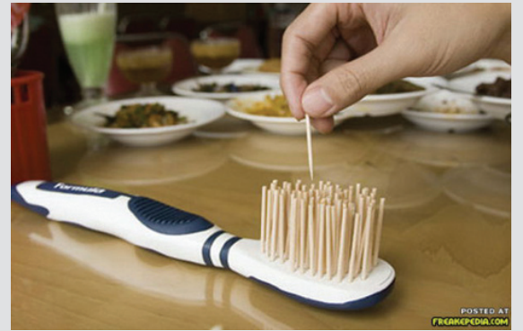
מברשת שיניים עם אפקט הקיסם