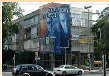
פרזנטור מאויר בהמשך לידיעה מהשבוע שעבר על

ברעם יזמה בשנת 2005 את הקונספט של מימון שיפוץ חזיתות של בניינים משותפים בתמורה לזכויות הפרסום על גב הפיגומים בזמן השיפוץ. החברה מימנה שיפוצים של עשרות בניינים משותפים בתל אביב בעלות של כ-20 מיליון ₪. כיום - השם 'ברעם' הנו שם גנרי לתחום הפרסום על גב קירות ענק.