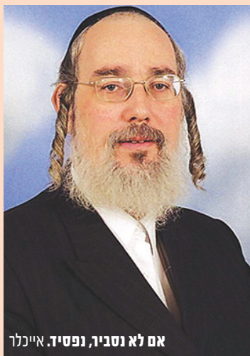
אם לא נסביר, נפסיד. אייכלר

כמדי שנה תערוך 'פרוג' תחרות קריאייטיב, כאשר הקונספט שנבחר השנה הוא 'הסברה חרדית' • חברת 'פרוג' משלבת ידיים עם 'המרכז להסברה יהודית', בראשות הרב ישראל אייכלר, במטרה "לעצב דעת קהל" • ביום העיון המקצועי יחולק מגזין נושא ובו פאנלים מרתקים שנערכו עם מגוון אנשי מקצוע, כדוגמת עיתונאים, יח"צנים ועוד • כל הפרטים